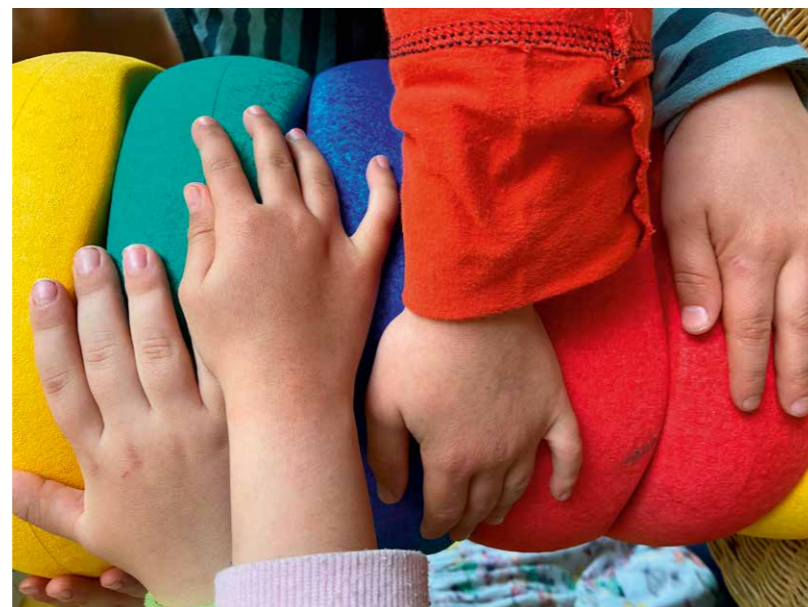
Kita Arche Noah