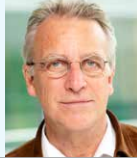
Stefan Wenzel, MdB (Bündnis 90/Die Grünen)

2013–2017 Niedersächsischer Minister für Umwelt, Energie und Klimaschutz, seit 2021 Mitglied des Deutschen Bundestages