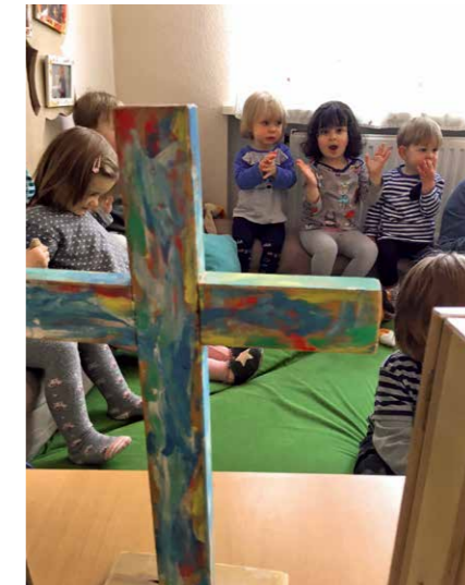
Kinderkirche in der Kinderkrippe „Die ViWALDIS“