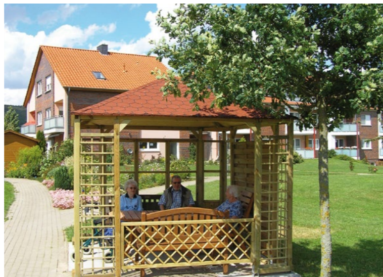
Mit Hilfe des Fördervereins wurde im Juni 2011 dieser Pavillon errichtet

Freunde hatte das Diakoniezentrum schon immer. Mit ihrer Hilfe konnten Projekte verwirklicht werden, wie wir sie mit Unterstützung des Vereins fördern werden, zum Beispiel die Internetschulung oder die Jägerspiele.